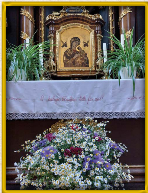
Blumenschmuck war ein Geschenk für die Klosterkirche

Beichtgelegenheiten und weitere Gottesdienste finden gemäß Planaushang statt. Die genauen Zeiten entnehmen Sie bitte dem Schaukasten, der Gottesdienstordnung, dem Martinsboten sowie dem Internet.