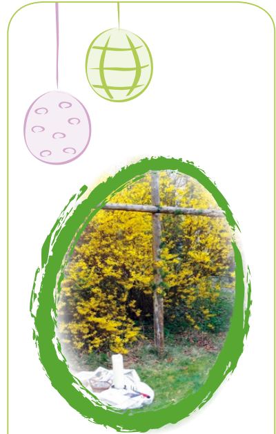
Bild: Karfreitag im Klostergarten 2012

Bitte nutzen Sie auch, wenn möglich, unsere Homepage ( www.klosterverein-forchheim.de ), unter der viele Termine einzusehen sind. Der Schaukasten an der Klosterkirche wird ebenso regelmäßig aktualisiert.